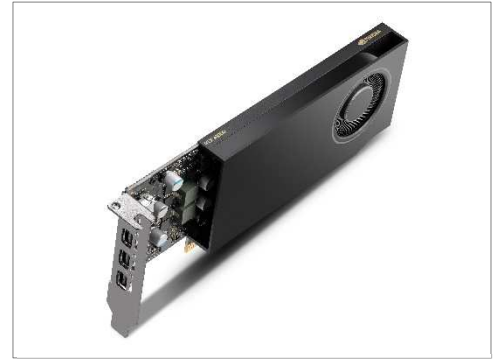
同 RTX シリーズ新製品「NVIDIA RTX™ A1000」

菱洋エレクトロでは、同 RTX シリーズ新製品「NVIDIA RTX™ A1000」も取り扱いを開始しており、お客様のニーズに合わせてご提案いたします。