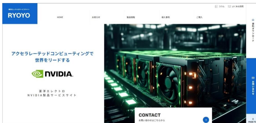
菱洋エレクトロがリニューアルした特設サイト「NVIDIA 製品サービスサイト」